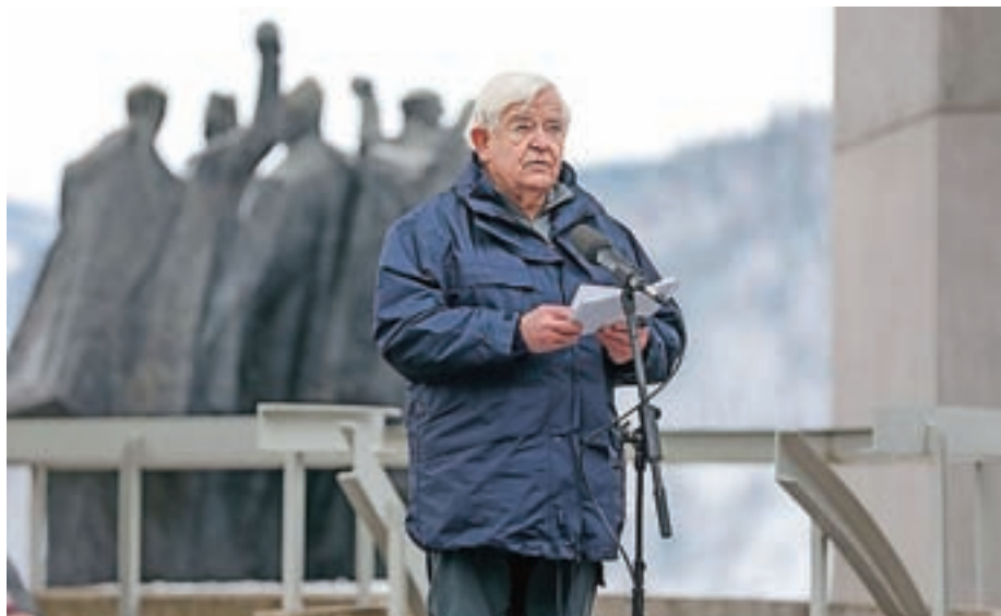
V Dražgošah je bil slavnostni govornik nekdanji predsednik republike Milan Kučan.