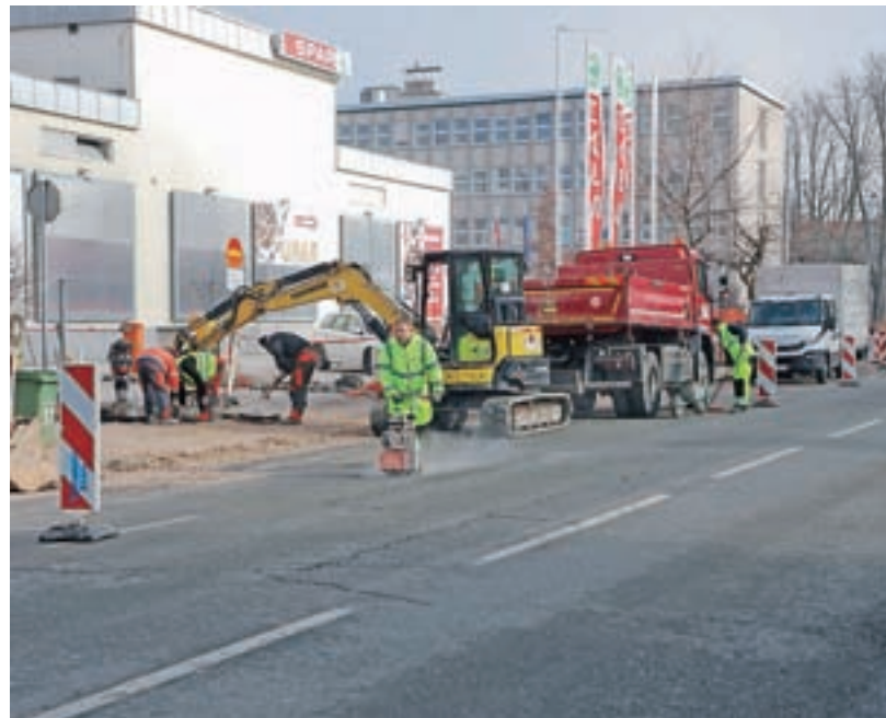
Na Cesti Staneta Žagarja od začetka februarja gradijo novo kolesarsko povezavo.

Investicijo, vredno približno 437 tisoč evrov, sofinancirata Republika Slovenija in Evropska unija iz Evropskega kohezijskega sklada v višini dobrih 242 tisoč evrov, občina pa bo prispevala preostalih 194 tisoč evrov.