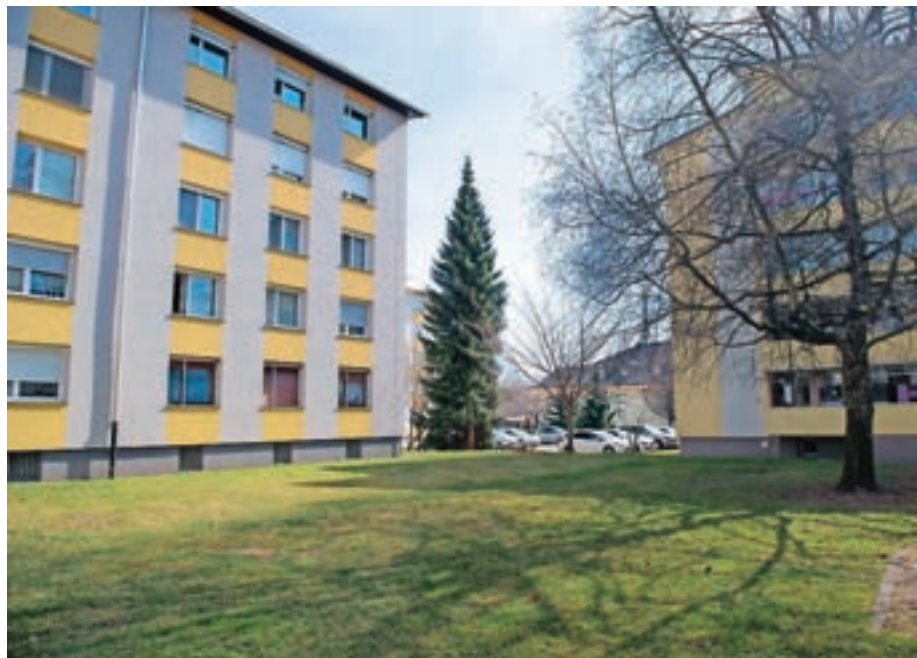
V KS Vodovodni stolp je največ glasov prejel predlog ureditve otroškega igrišča in parka za sprostitev na zelenici na Valjavčevi ulici.

Predlog rekonstrukcije parkirišča Begunjska ulica 12 je prejel 35 glasov, pre-