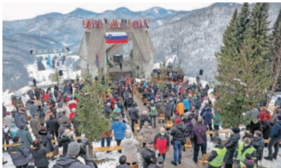
Udeležili smo se tudi slovesnosti ob 80. obletnici boja Cankarjevega bataljona z nemškimi vojaki v Dražgošah.