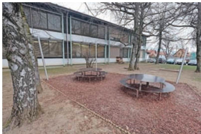
Učilnica na prostem